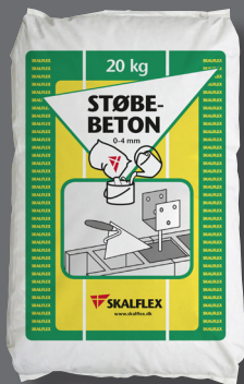
20 kg; DB-nr. 2110354