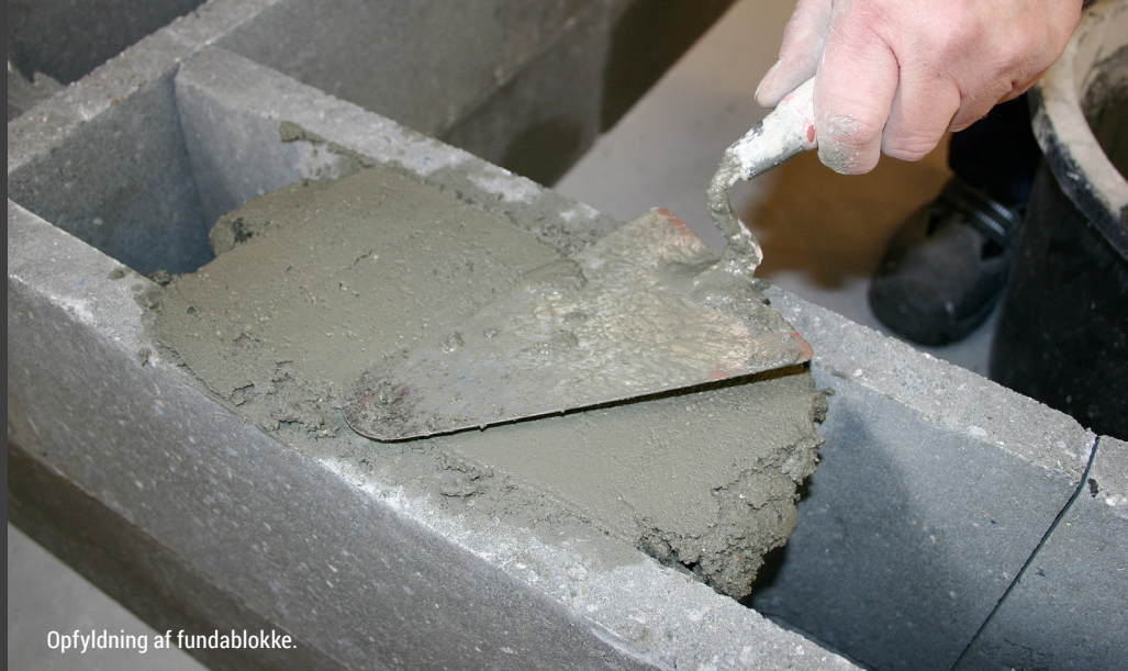
Opfyldning af fundablokke.