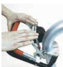
Trin 3 Løft hæve og sænke grebet (D) og maskinen vil begynde at slibe