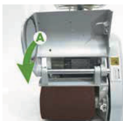
Trin 3 Luk låget