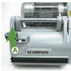
Trin 1 Løft låget