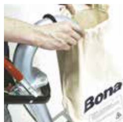
Trin 4 Monter støvpose