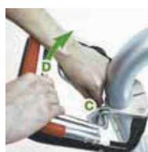
Trin 2 Træk udløseren mod venstre for startgreb (C) samtidig med at startgrebet holdes nede