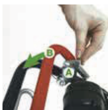
Trin 1 Træk udløser for startgreb (E) baglæns og aktiver startgrebet (C)