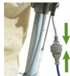
Trin 5 Tilslut strømkabel og nu er du klar