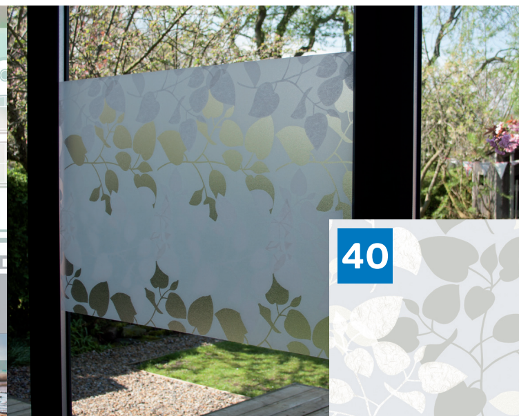
static PREMIUM Amena