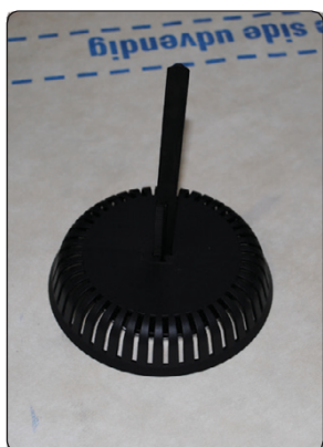
Ventilstuds er nu monteret. Undertag må ikke være ujævnt eller foldet, undgå montering i overlæg ved fast undertag