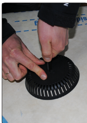
Overdelen presses ned mod undertaget, det er vigtigt at begge dele strammes hårdt sammen for at sikre tæthed til undertag.