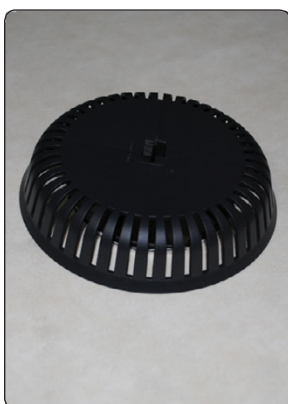
Færdigmonteret, set udefra Afprøv om yderdelen slutter helt tæt til undertaget.