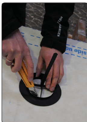
Marker og skær hul i undertaget

KimaAir OUTSIDE/IN Ventilstuds er til udluftning af kolde tagrum.