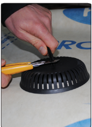
Stripsen skæres af, ca. 1 cm over dækslet