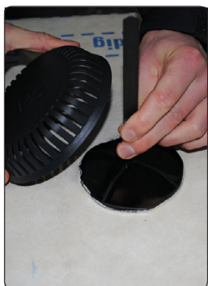
Hold fast i stripen, og monter overdelen.