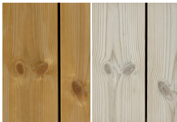
Sature som nyt