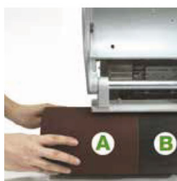
Trin 2 Skub båndet indover valsens