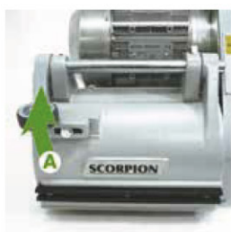
Trin 1 Løft låget