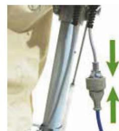
Trin 5 Tilslut strømkabel og nu er du klar