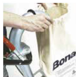
Trin 4 Monter støvpose