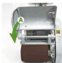
Trin 3 Luk låget