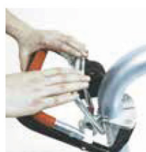
Trin 3 Løft hæve og sænke grebet (D) og maskinen vil begynde at slibe