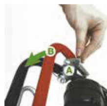
Trin 1 Træk udløser for startgreb (E) baglæns og aktiver startgrebet (C)