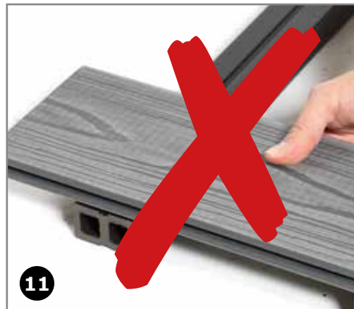
11 Alle brædde-enderne skal fuld understøttes.