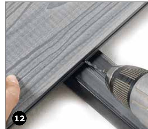
12 Hver enkelt bræt bores for med 4 mm. bor, midt på brættet og ned i en strø.