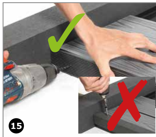
15 Montage af kant- og hjørnelister sker fra siden – aldrig fra oven. Husk at bore for i listerne.