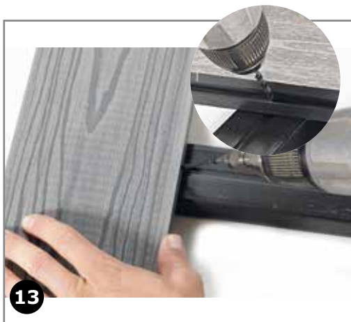
13 Derefter monteres en rustfri skrue som fiksering. Dette sikrer ens bevægelse i brædderne.