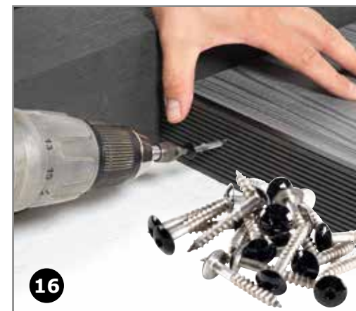
16 Brug altid rustfri skruer med stort hoved.