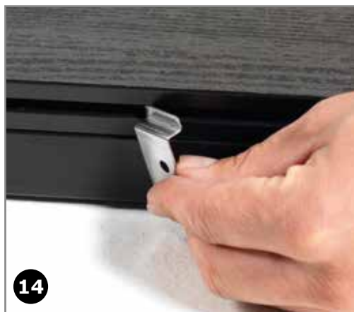
14 Til sidst monteres slutbeslag pr. 300 mm.