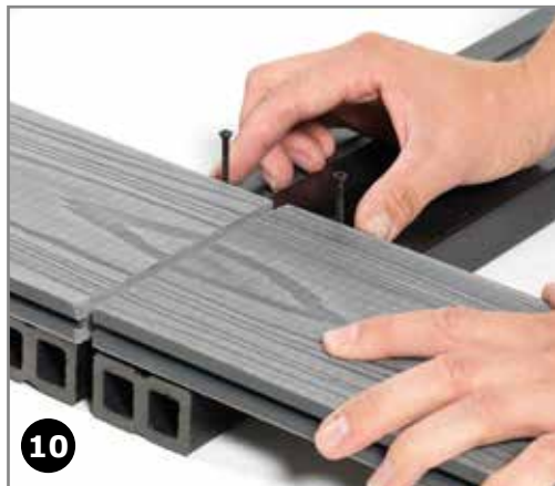
10 Der monteres clips i begge strøer – en samling må ikke deles om en enkelt clips.