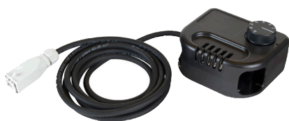
Mulighed for tilkøb af rumtermostat