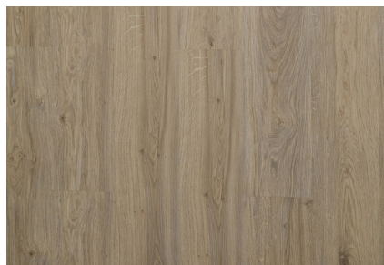
Pastel Oak 80002831