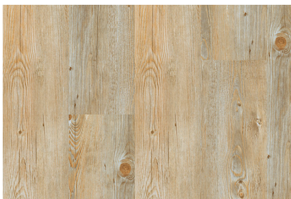
Alaska Oak 80002830

Wicanders START - LVT • Til svømmende montage med 2G • Dim: 9,0x185x1220 mm