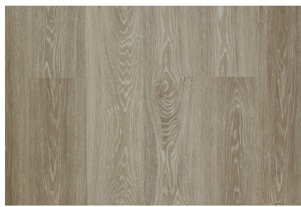
Washed Tundra Oak 80002833