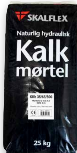
25 kg DB-nr. 1900774

Se sikkerhedsdatabladet, som forefindes på www.skalflex.dk for yderligere oplysninger.