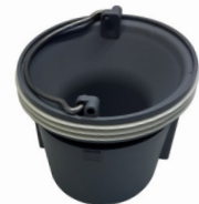
FlexOne uden adapter-ring

FlexOne utan adapter kan erstatte den gl. hvide vandlås. (VVS.nr. 153448-516).