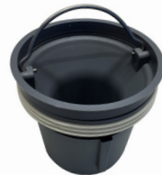
FlexOne med grå adapter-ring monteret

FlexOne med grå adapter kan erstatte den gl. grå vandlås. (VVS.nr. 153453-516).