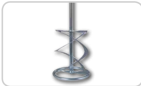
Leveres inkl. WG 120 rørestav