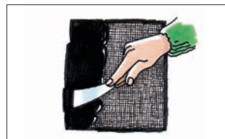
Der påføres to lag Tagkit.