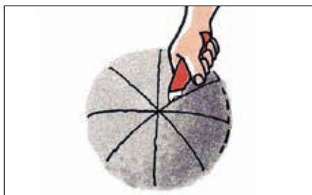
Buler skæres op.

Vandbaseret: Icopal 2000-produkterne skal opbevares frostfrit (min. +5 °C). Våd asfalt fjernes med vand. Tør asfalt fjernes med terpentin.