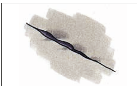
Revner sømmes til, og der påføres Tagkit som under buler.