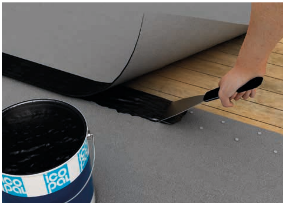
Overlæg svejses normalt, men kan også koldklæbes.

Eventuelle rester på redskaber fjernes med terpentin. Kommer det på huden bruges rensecreme og vaskes efter med vand og sæbe.