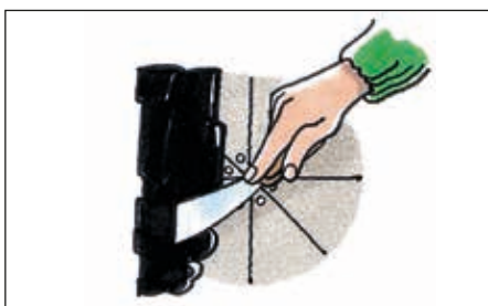
Flige trykkes tilbage, og der sømmes i spidser.