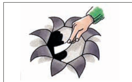
Underlaget skal være helt tørt, før der påføres Icopal Tagkit.